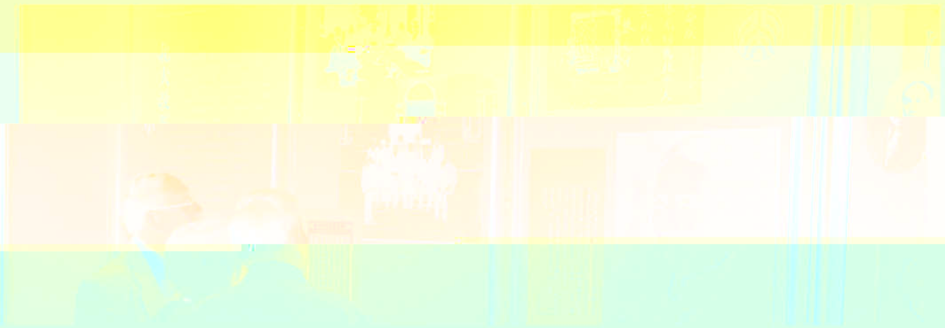
蔡元培先生著作展览在北京大学教育学院隆重开幕